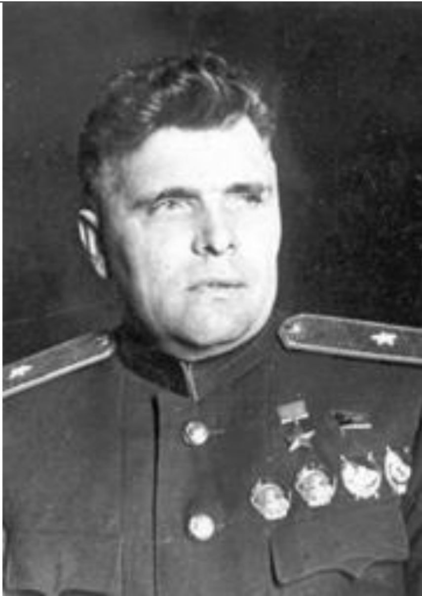
Михаил Васильевич Водопьянов (1899—1980)

В армии с 1919 года. Служил обозным в Дивизионе воздушных кораблей, с 1920 года – помощник шофёра, с 1921 года – шофёр. Участвовал в Гражданской войне.