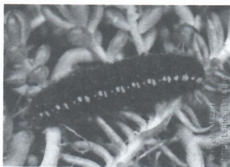
Гусеница на очитке (сем. Толстянковые)