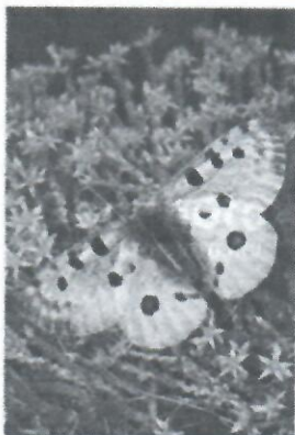
Аполлон обыкновенный на Очитке едком

Аполлон обыкновенный – представитель семейства Парусников отряда Чешуекрылых. Места обитания: луга, горные луга, степи, открытые пространства. Кормовые растения гусениц – виды семейства Толстянковые (суккуленты родов Очиток и Молодило). Зимуют новорожденные гусеницы, находясь в оболочке яйца, у некоторых подвидов – вне оболочки. Известны случаи досрочного выхода зимующих гусениц из яйца при сильных оттепелях зимой и ранней весной. Вид обладает слабой способностью к миграциям при сильно удалённых друг от друга популяциях.