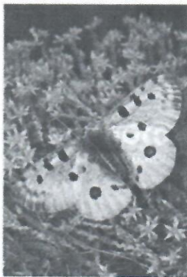
Аполлон обыкновенный на Очитке едком

Аполлон обыкновенный – представитель семейства Парусников отряда Чешуекрылых. Места обитания: луга, горные луга, степи, открытые пространства. Кормовые растения гусениц – виды семейства Толстянковых (суккуленты родов Очиток и Молодило). Зимуют новорожденные гусеницы, находясь в оболочке яйца, у некоторых подвидов – вне оболочки. Известны случаи досрочного выхода зимующих гусениц из яйца при сильных оттепелях зимой и ранней весной. Вид обладает слабой способностью к миграциям при сильно удалённых друг от друга популяциях.