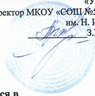
График прихода обучающихся в МКОУ «СОШ №5 г. Баксана им. Н. И. Нагоева»